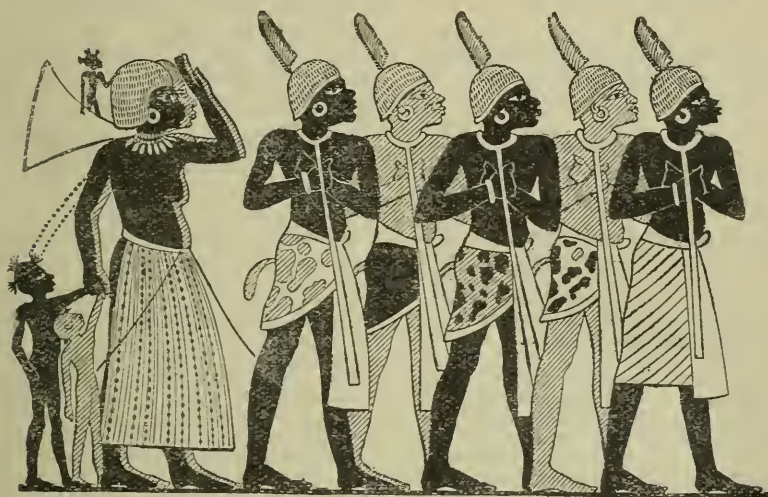
Groupe de captifs nègres. (Peluturs égyptienne.)

que Jéhovah aura exercé ses jugements. — Labium electum. Hébr.: une lèvre pure. Les lèvres des idolâtres, qui proféraient sans cesse les noms des faux dieux, étaient profondément souillées (cf. Os. II, 19); le Seigneur les purifiera, pour les rendre capables de l'invoquer lui-même dignement. — Ut invocent... Ce trait suppose, évi-