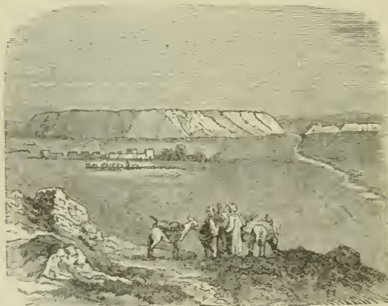
Ruines de Ninive. (Koyounchick.)

Sous ce nom il faut aussi comprendre les Égyptiens, car les deux peuples n'en formaient alors qu'un seul, gouverné par la dynastie dite éthiopienne. — Interfecti gladio meo... Les Chaldéens, puis Cambyse avec ses Perses, exécutèrent cette menace. Comp. Ez. xxx, 4-9, où elle est plus développée. Plus bas, iii, 10, il sera question d'une défaite d'un autre genre, que l'Éthiopie devait subir pour son plus grand bien. — Versets 13-15: Malheur à l'Assyrie. Cet oracle se réalisa lorsque Ninive et son empire gigantesque furent renversés par les Babyloniens et les Mèdes réunis. — Super aquilonem . L'Assyrie était située dans la partie septentrionale des contrées bibliques ( Atl. géogr. , pl. i et viii). — Speciosam in solitudinem . Hébr.: il fera de Ninive ( Niniveh ) une solitude. De même les LXX, le Targum et le syriaque. — Et accubabunt... (vers. 14). Développement poétique de la seconde moitié du vers. 13. — Omnes bestiarum gentium . Les troupeaux des nations voisines viendront paître sur l'emplacement de Ninive ruinée et délaissée. Comp. les vers. 6-7. L'hébreu a ici une locution extraordinaire: