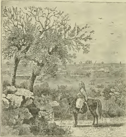
Accaron. (État actuel.)

— Funiculus maris est un hébraïsme, qui désigne le territoire des Philistins, part d'héritage qui est censée avoir été mesurée pour eux au cordeau, selon l'ancienne coutume. Cf. Deut. xxxii, 9; Ps. xv, 6, etc. Il était situé le long de la mer Méditerranée ( Atl. géogr. , pl. vii), à l'ouest du royaume de Juda. — Gens perditorum C.-à-d.: race condamnée à une ruine certaine. L'hébreu exprime un autre sens: Nation des K'rêfîm , ou des Crétois, selon l'opinion la plus probable. On suppose, en effet, que les Philistins étaient originaires de l'île de Crète. Cf. I Reg. xxx, 14, et Ez. xxv, 16, dans le texte original. Saint Jérôme, comme le Targum, Symmaque et Théodotion, a fait dériver ce nom de la racine kârat , extirper; de là sa traduction. — Chanaan . Les Philistins reçoivent probablement cette autre dénomination parce que, aussi mauvais et corrompus que l'antique race chanaanéenne, ils devaient partager sa funeste destinée.